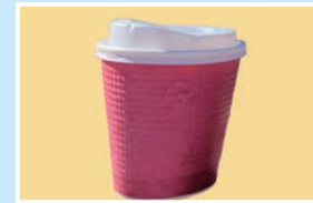
㉔コーヒー こまカフェ;木曜定休/10:00~17:00 ウッドイーン;火曜定休/9:00~19:00