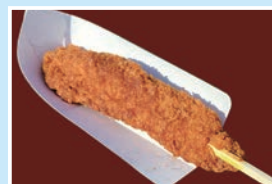
㉑ソースかつ棒 すずらんハウス 火曜定休/10:00~17:00