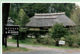
⑫旧竹村家住宅 月曜定休/9:00~17:00