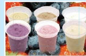
㉒すずらんシェイク すずらんハウス 火曜定休/10:00~17:00 こまカフェ;木曜定休/10:00~17:00