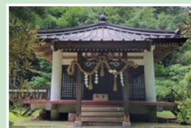
⑯高尾山分霊院 拝観自由