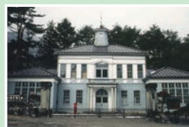
⑬駒ヶ根市郷土館 月曜定休/9:00~17:00