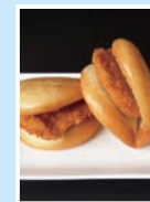
⑱どんまん、ソーサカツサンド 明治亭 無休/11:00~15:00