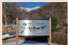
⑤高原モニュメント