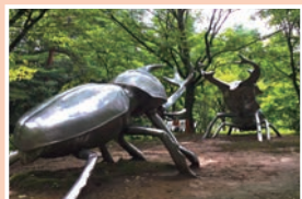
⑦森と水のアウトドア広場