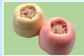
㉕赤飯まんじゅう 信州苑;年中無休/8:00~17:30