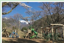
⑩中央アルプスこまつ子広場 入場自由