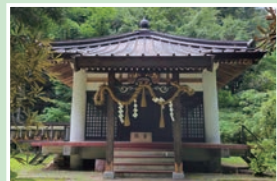
⑯ 高尾山分霊院 拝観自由