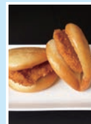
⑱ どんまん、ソースカツサンド 明治亭 無休/11:00~15:00