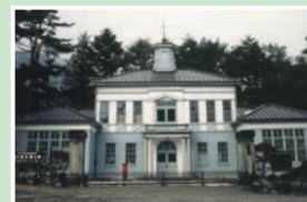
⑬ 駒ヶ根市郷土館 月曜定休/9:00~17:00