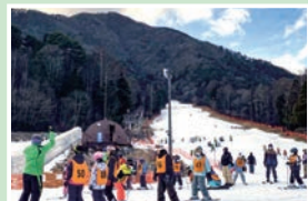
⑩ 駒ヶ根高原スキー場 営業期間中無休/9:00~16:00