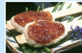
⑲ 五平餅 天山 不定休/11:00~売切れ次第終了