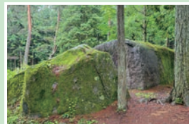
⑰ 切石 見学自由