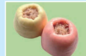
㉕ 赤飯まんじゅう 信州苑; 年中無休/8:00~17:30