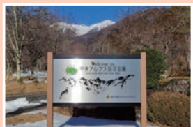
⑦ 高原モニュメント