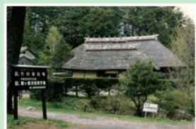
⑫ 旧竹村家住宅 月曜定休/9:00~17:00