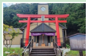
⑭ ひんころ神社 不定休/9:00~17:00