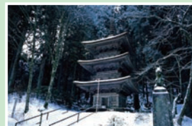
⑪ 光前寺 無休/8:00~16:30