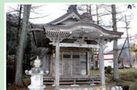
⑮ 観音堂 拝観自由