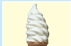
⑳ すずらんソフト すずらんハウス 火曜定休/10:00~17:00 こまカフェ; 木曜定休/10:00~17:00