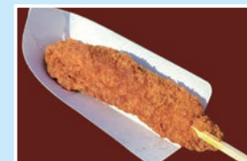
㉑ ソースかつ棒 すずらんハウス 火曜定休/10:00~17:00