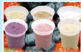
㉒ すずらんシェイク すずらんハウス 火曜定休/10:00~17:00 こまカフェ; 木曜定休/10:00~17:00