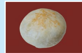
㉓ おやき こまカフェ; 木曜定休/10:00~17:00