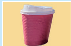
㉔ コーヒー こまカフェ; 木曜定休/10:00~17:00 ウッドイーン; 火曜定休/9:00~19:00